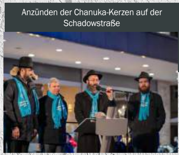
Anzünden der Chanuka-Kerzen auf der Schadowstraße