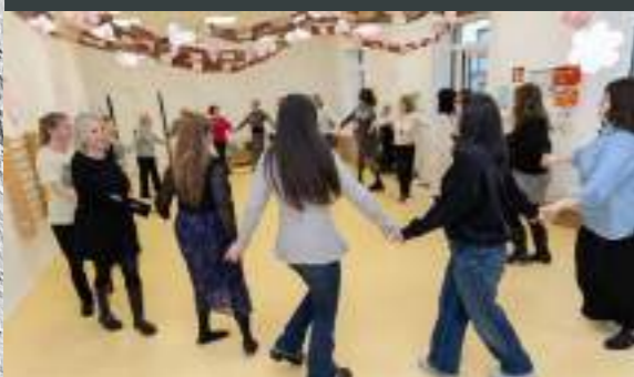
Frauenabend zum Thema wahre Schönheit - innen und außen