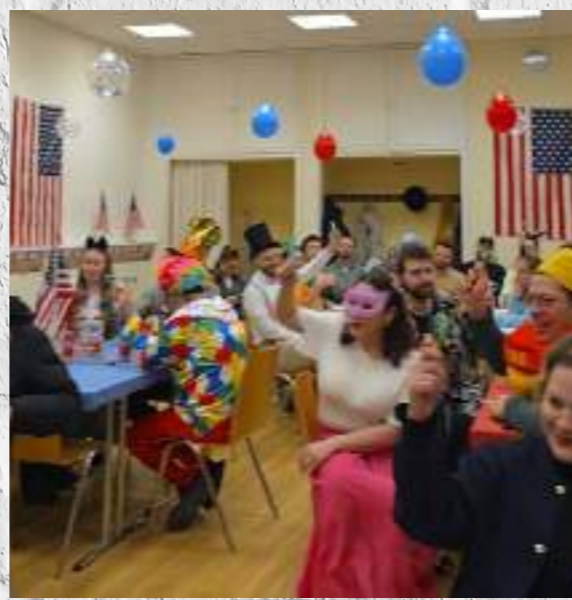
Purimfeier für Familien