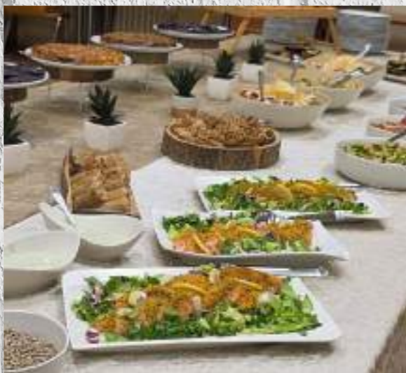
Farbregen zum Jud Tet Kislew