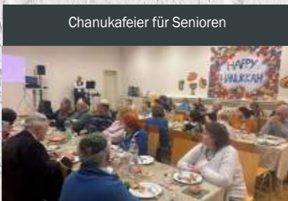
Chanukafeier für Senioren