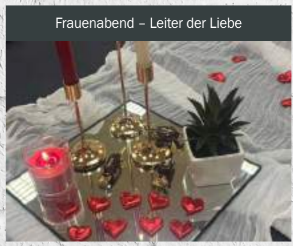
Frauenabend – Leiter der Liebe