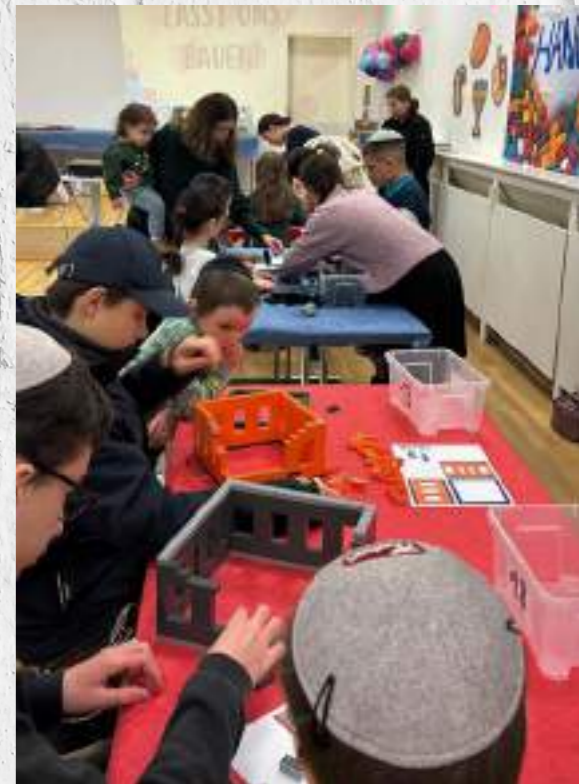
Wintercamp Gan Israel