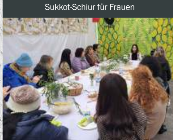
Sukkot-Schiur für Frauen