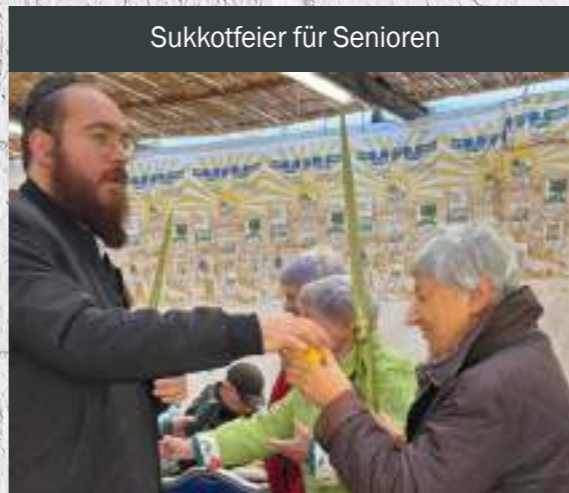
Sukkotfeier für Senioren