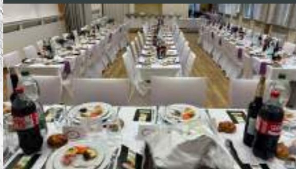
Rosch Haschana-Dinner bei Chabad