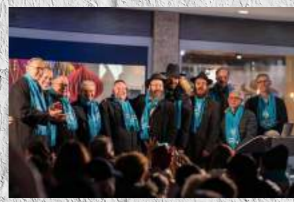
Chanuka im Nelly-Sachs-Haus, in der Tagespflege-Mondschein und in der Sonnenschein-Residenz