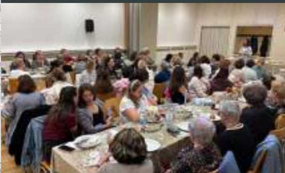
Frauenabend vor Rosch Haschana